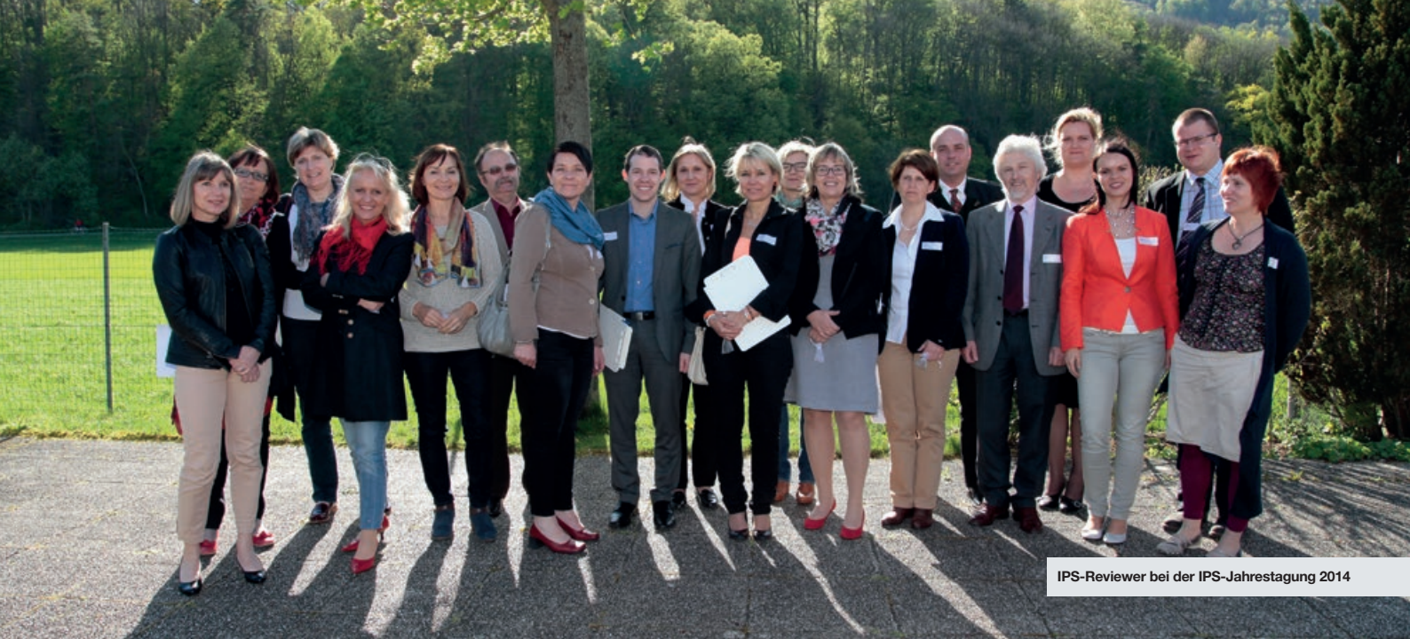
IPS-Reviewer bei der IPS-Jahrestagung 2014

die Basis für die Weiterentwicklung der eigenen Systeme. Regelmäßig werden Indikatoren wie z.B. der Anteil der anonymen, bearbeitbaren oder zu Lösungen führenden Meldungen, Feedback- und Bearbeitungsdauer oder Evaluierungsgrad erhoben, anonymisiert und in gemeinsamen IPS-Indikatoren-Netzwerktreffen analysiert. Sie dienen ausschließlich den IPS-Mitgliedern zur Orientierung und zur Optimierung ihrer Patientensicherheitsarbeit.